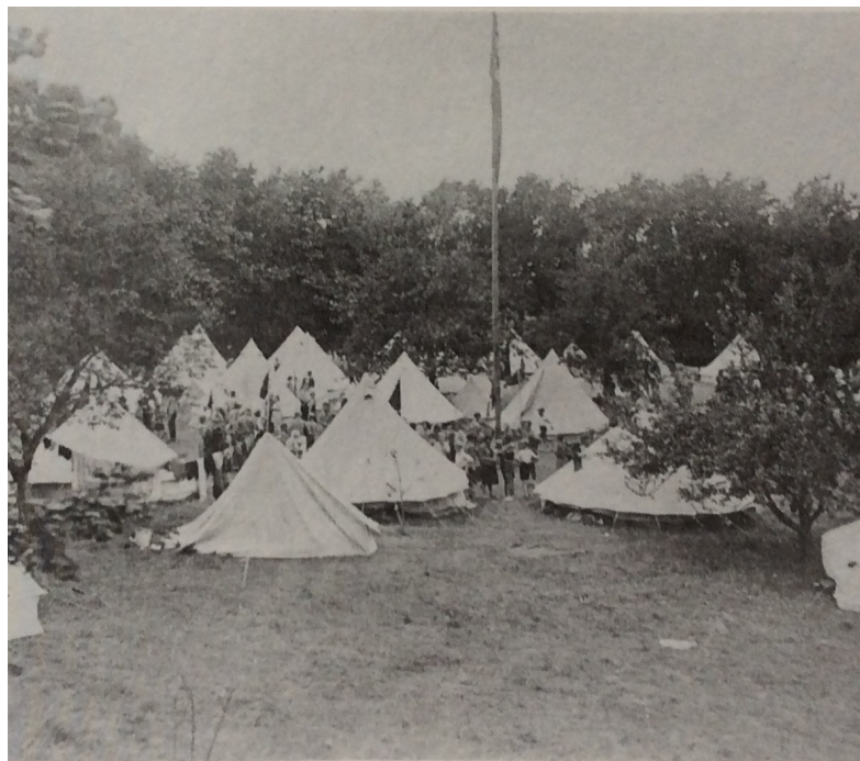
Ø-lejre på Lille Okseø

Lille Okseø blev i samme periode benyttet til et beskæftigelsesprojekt for unge ledige, men da deltagerne rejste hjem den 1. oktober 1937, var det slut med såvel ø-lejr for DUI som for beskæftigelsesprojektet for unge ledige, de større byer havde besluttet selv at aktivere de ledige.