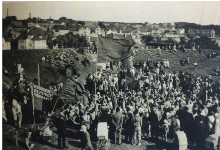
Brohovedlejr pinsen 1931

De skulle overnatte i telte, som blev slået op i Brohovedskansen. Lørdag kl. 21,30 var de sidste ankommet og man gik i demonstrationsoptog gennem byen, det blev dog en kort tur, idet Sønderborgs politimester havde forlangt, at de var tilbage i Skansen kl. 22, musikledsagelse blev der heller ikke givet tilladelse til.