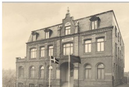
Bjerggården, Bjerggade – Arbejderbevægelsens højborg 1905-1975